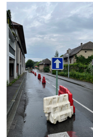
Photos de la mise en place du test