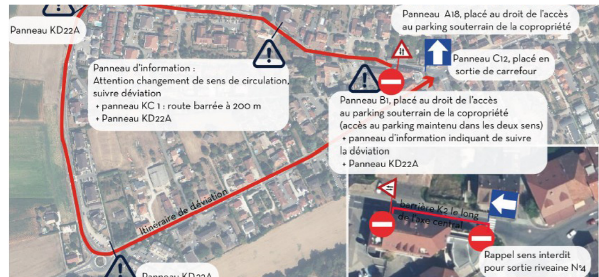
Cartographie descriptive de la signalisation à mettre en œuvre durant la phase de test