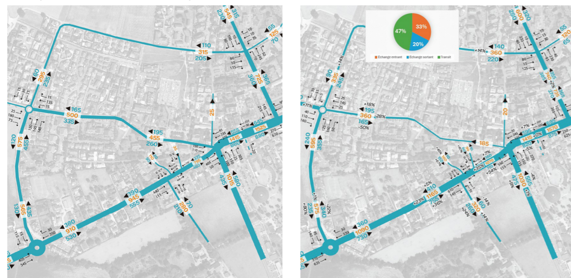
Réalisation de comptages avant et après la phase de test