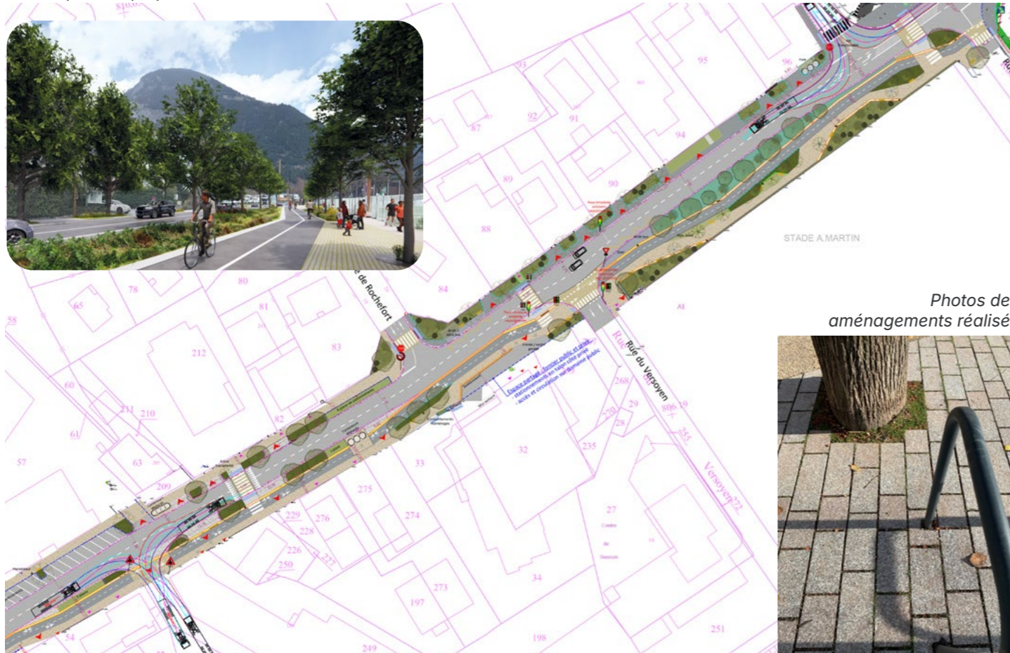
Photos des aménagements réalisés