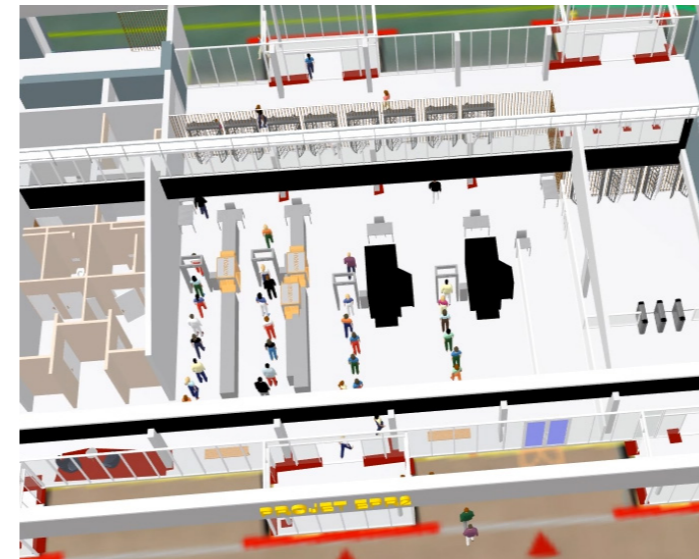
Modélisation des flux piétons en accès au PAC