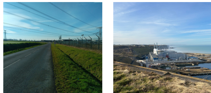
Ambiance des lieux