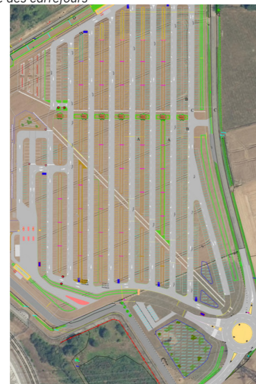
Assistance à la réalisation du parking d'accès au PAC - 2000 places - inauguré en 2026