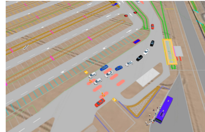
Modélisation des barrières d'accès au parking