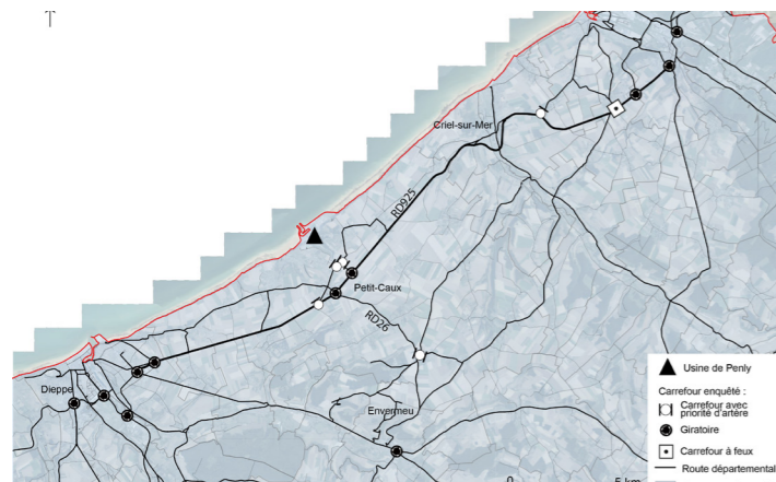
Analyse macroscopique du territoire