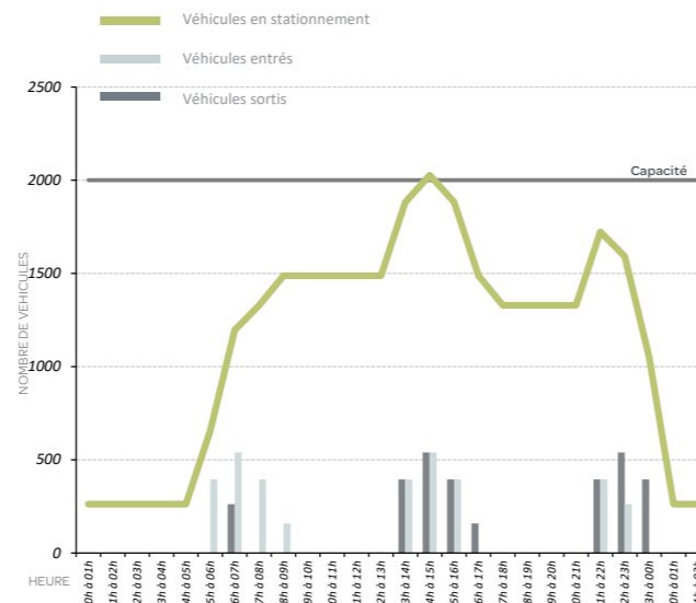
Analyse de la demande de stationnement