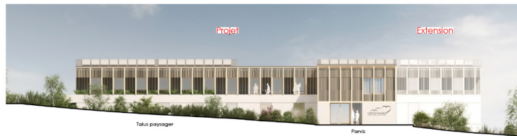
Façade Sud sur Avenue Paul-Louis Merlin