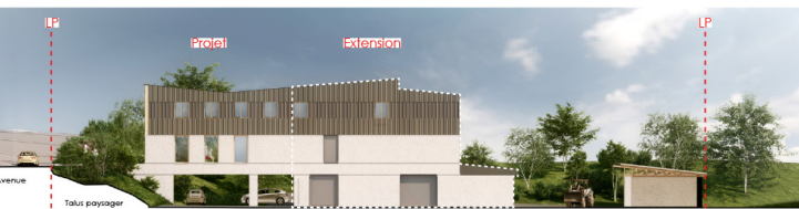
Façade Est sur cour logistique