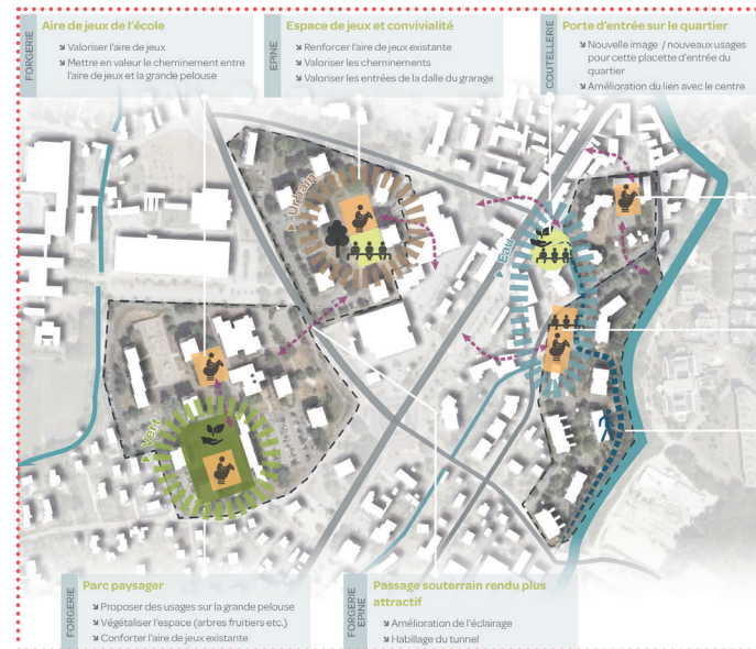
Schéma d'intentions ▼