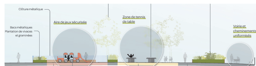
Quartier de la Paterie - Coupe ▲