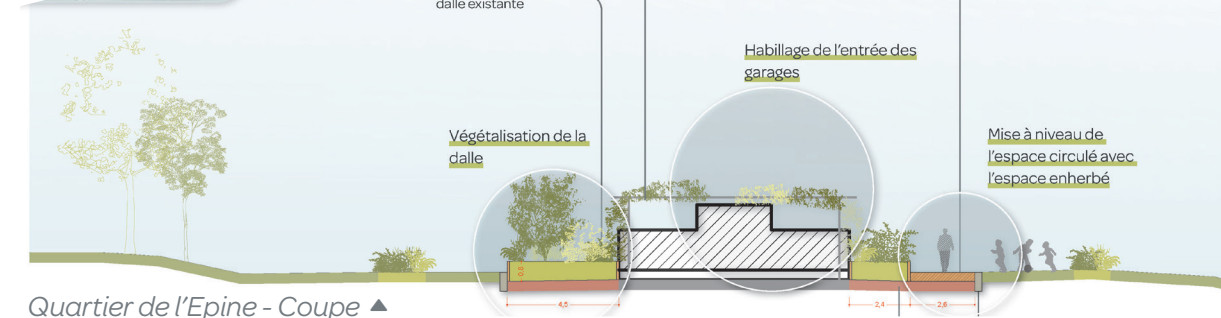
Quartier de l'Epine - Coupe ▲