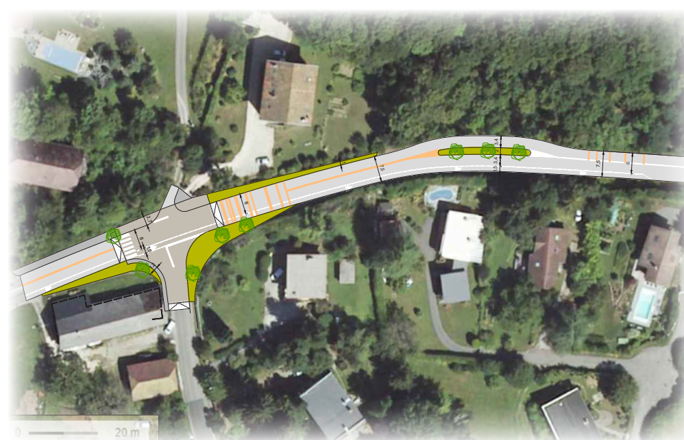
Esquisses proposées pour l'entrée Nord ▲ et aménagement réalisé en 2023 ▼