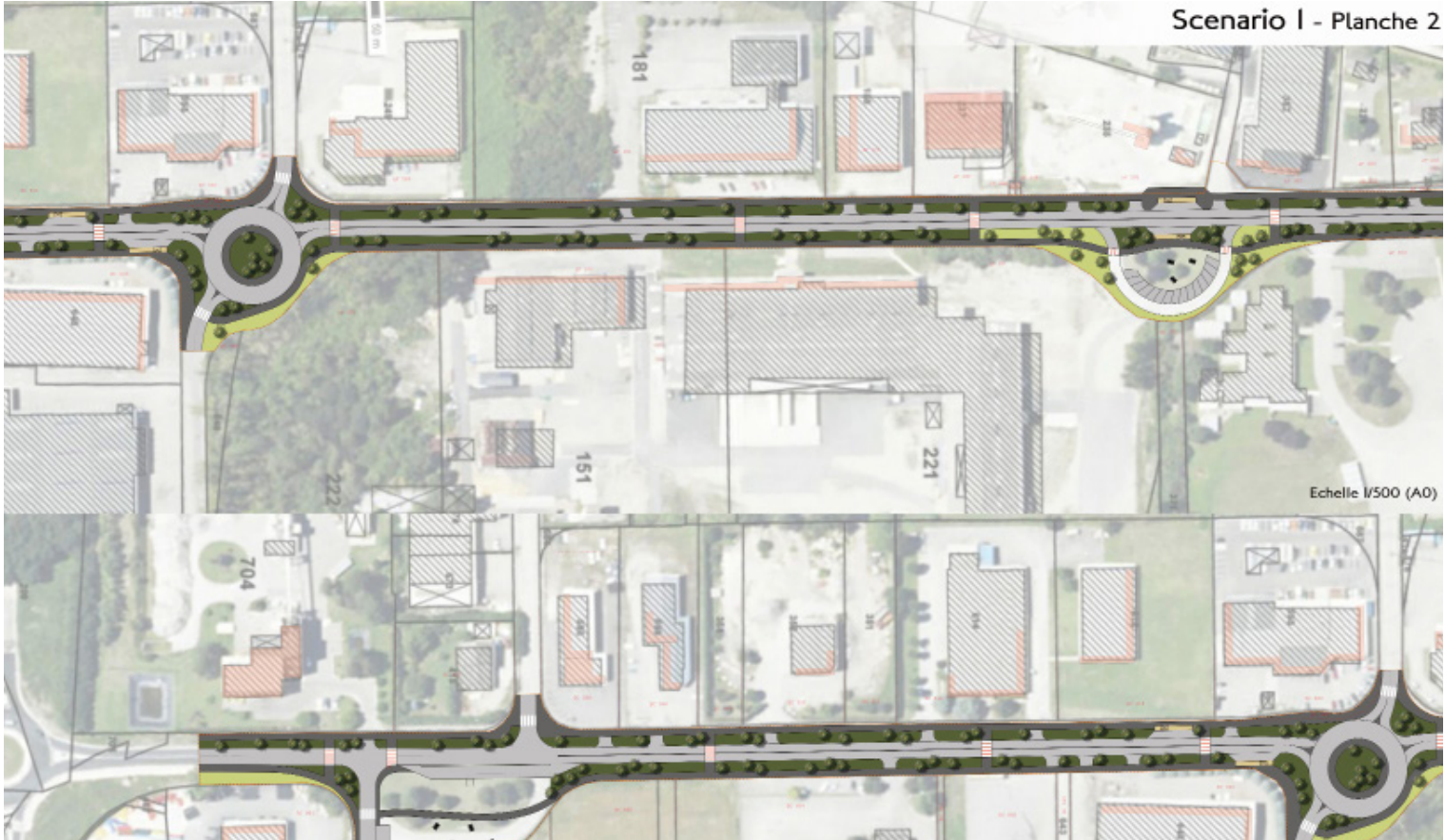
Scenario I - Planche 2