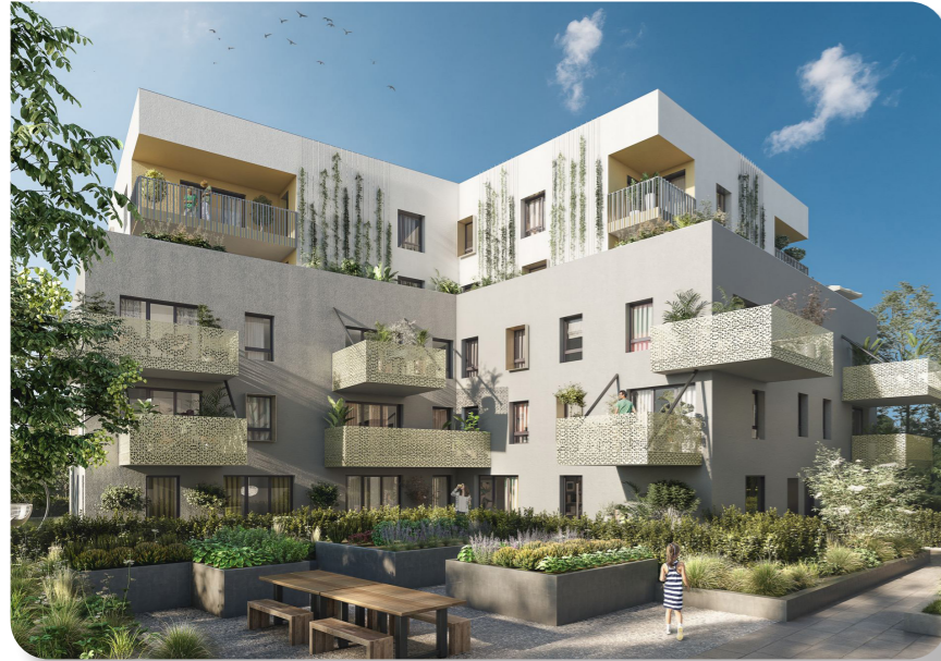
Jardin en cœur d'îlot ▼