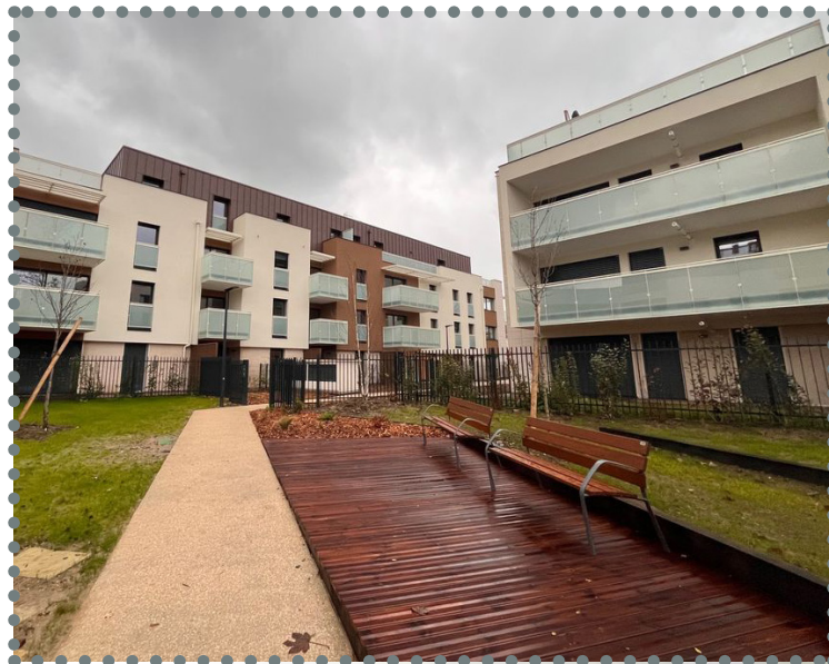
Cheminements et terrasses bois réalisés ▲