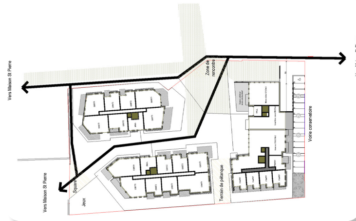
Schéma d'intention ▼