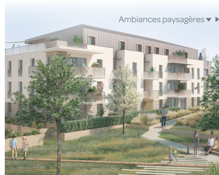
Ambiances paysagères ▼ ▶