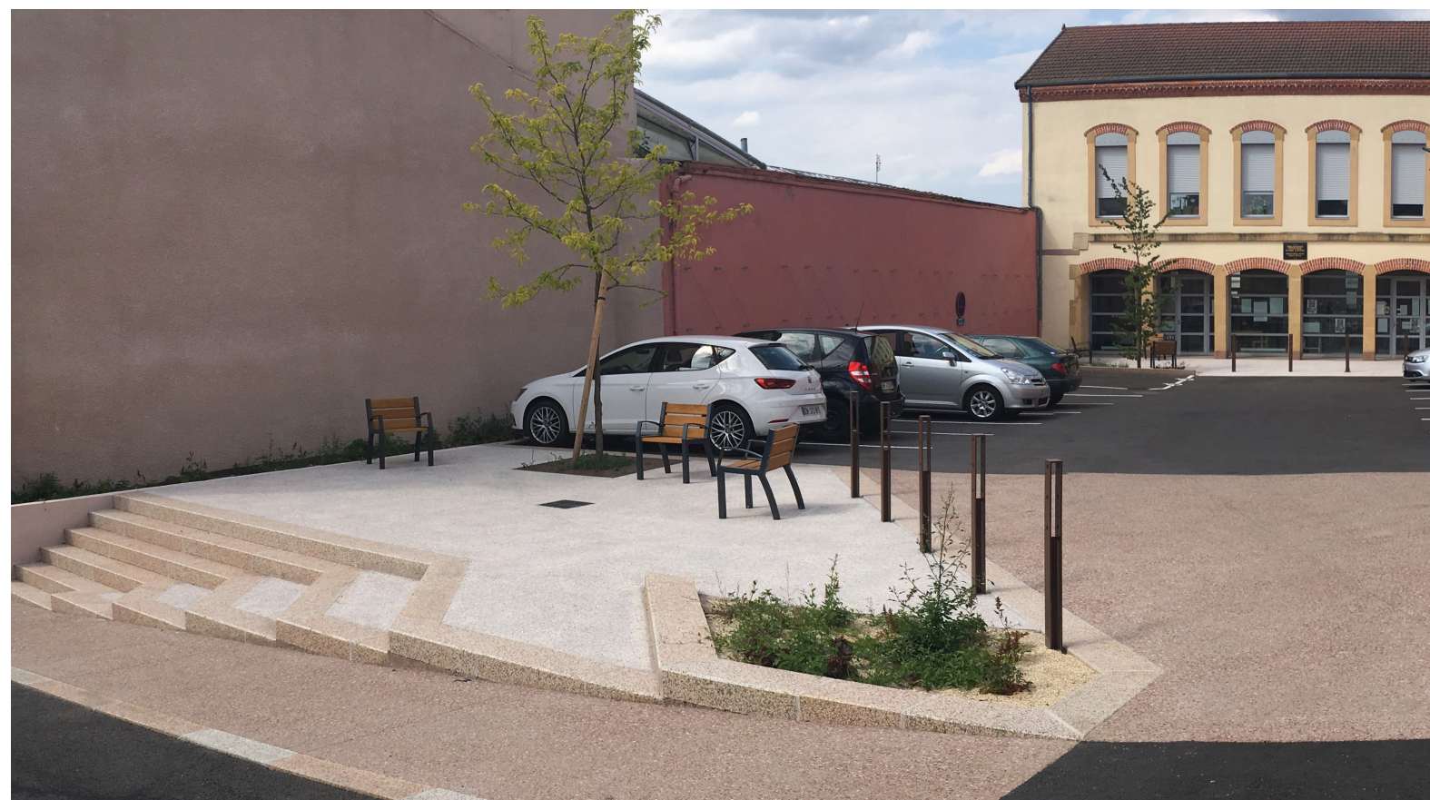
Photographies des projets réalisés ◀▼

Étendue projet | Centre-bourg - 13 500 m 2