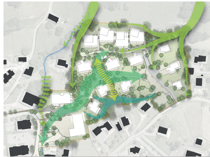
Principes paysagers ▼