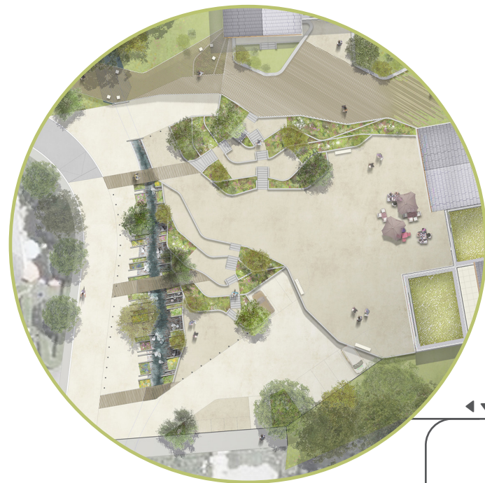
Perspective sur la place