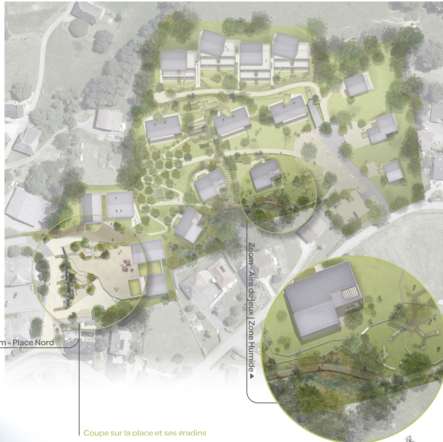
Coupe sur la place et ses gradins