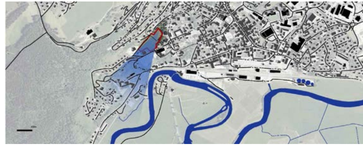
Etat des lieux ▼