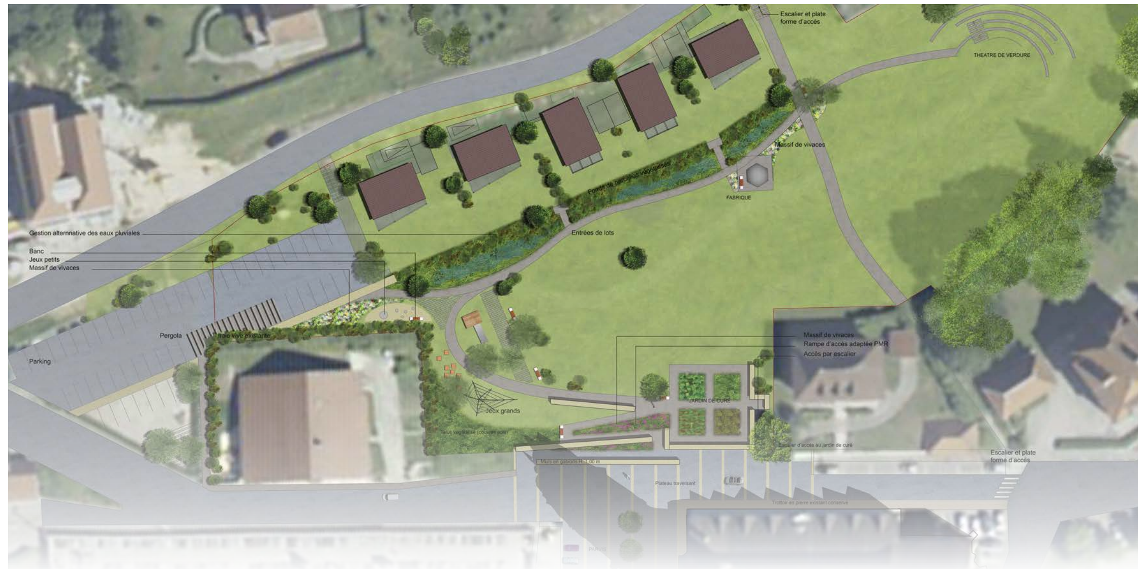
Esquisse d'aménagement du Clos Notre Dame ▼

Les équipements structurants quant à eux, bénéficient d'un traitement très qualitatif, à la conception robuste et à l'entretien facilité par la proximité des accès.