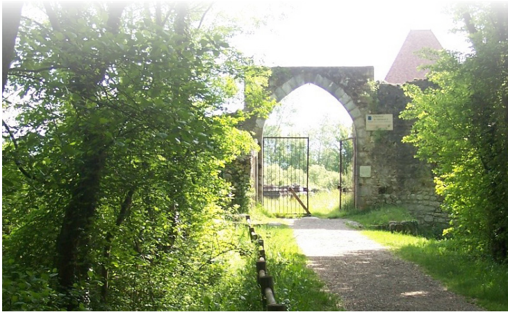
Etat des lieux du site - approche globale ▼