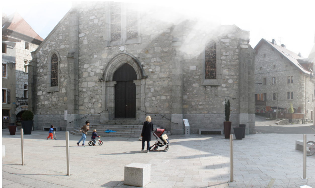
Place St Julien ▼